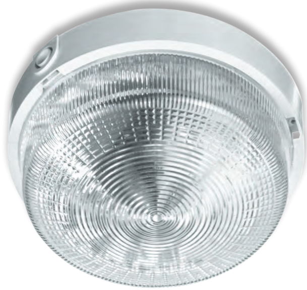
RONDO 1x100W OPAL